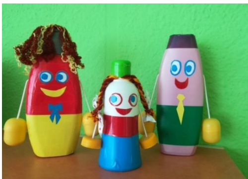
Весёлая семья шумелок